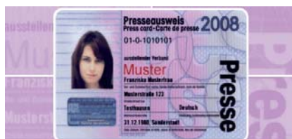
Abgewirtschafteter Presseausweis: Nur noch ein Kärtchen wie viele

„Das merkt doch keiner,“ trösteten sich in Kiel die Verantwortlichen des schleswig-holsteinischen DJV-Gaus über den Verlust des „amtlich anerkannten“ Presseausweises hinweg. Daß Benno „The Loser“ Pöppelmann, der Mega-Verlierer des deutschen Verbandswesens, das Hauptargument für die teure Mitgliedschaft im DJV durch verbandstypische Kombination aus abenteuerlicher Selbstüberschätzung und arrogante Verachtung für andere bei der Innenministerkonferenz am Nikolaustag 2007 versenkt hatte, nimmt man an der Förde wie all die anderen fatalen Niederlagen apathisch hin.