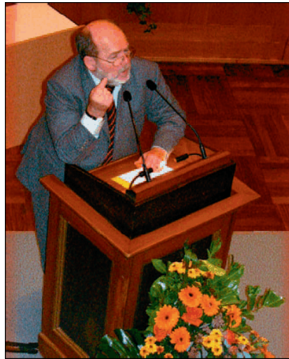
Der Linke und das Geld: Geibel-Land ist abgebrannt

60.000 Euro soll die Abzocke nach Raubritterart in Geibels Kasse spülen. Viel spricht dafür, daß dies bei weitem nicht reichen wird, die laut geheimem Lagebericht „finanzielle Schiefelage“ des Landesverbands Baden-Württemberg zu beseitigen. Allein der Mitgliederverlust im sektenähnlich abgeschotteten Südwest-Club kostet jährlich über 30.000 Euro. Da reichen 60.000 nicht weit.