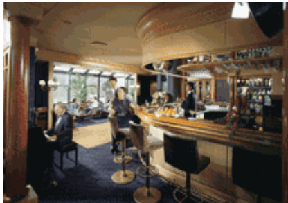
Bar im Maritim Grand Hotel Alles rein privat, aber der DJV zahlt

Derweil befragte ein Mann im hellen Jackett („Agent Orange“) die Hotel-Angestellten im Back Office nach bestimmten Buchungen.