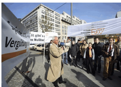
General Pistorius dicht am Feind: Konkens Dolchstoß in den Rücken

Doch nun ist es geschehen: Gequälten Gesichts verkündete der Ex-Marketing-Berater und Ex-Presse-sprecher den betreten dreinschauenden Gewerkschafts-Mogulen, man müsse wohl dem Vorschlag von Insolvenzverwalter Michael Frege zustimmen. Der hatte faktischen Verzicht durch „qualifizierten Rangrücktritt“ über schlappe 235.529,62 Euro und sofortigen endgültigen Verzicht auf weitere 132.000 Euro gefordert, andernfalls er mit den immer noch zahlenden 2.250 Berliner Mitgliedern aus dem DJV austreten werde.