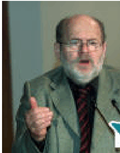
Gewerkschafts-Meduse Geibel: Ein Raffzahn gibt den Wohltäter

Glaube. Jetzt weht der „Wind of change“ durch die Geschäftsstellen, Finanzämter stellen ungewohnte Fragen oder machen, wie in Stuttgart oder Düsseldorf, überraschende Hausbesuche.