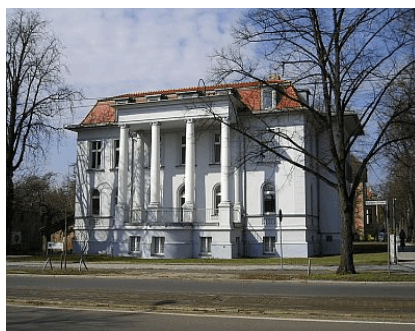
Amtsgericht Potsdam: Keine neue Satzung eingetragen