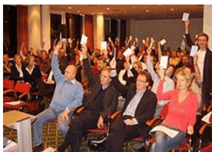
VBJ-Jubler stimmen für Fusion: Der Rest ist Schweigen

Es ist der DJV-typische Dilettantismus. Verbandseigene Groß-Juristen wissen genau, wie es geht. Und dann geht es schief.