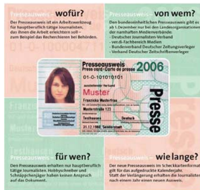
„Bundeseinheitlicher“ Presseausweis: Ist der DJV aus dem Geschäft?