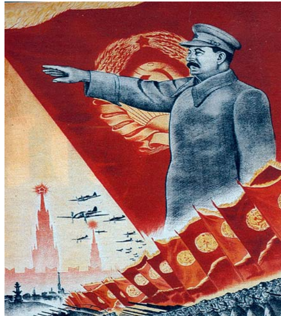
Diktator Stalin: Mit Know-how gegen Opposition

mit Wehmut an den Mann aus Georgien, der nie ein langes Problem mit Andersdenkenden hatte. Der Deutsche Journalisten-Verband (DJV) läuft immer tiefer in ein unauflösliches Dilemma: Einerseits will die 40.000 Mitglieder zählende Organisation eine machtvolle Gewerkschaft sein, die durch „Solidarität“ die „Unternehmer-