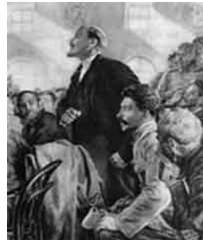
W.I. Lenin: Mit Demokratie die Demokratie abschaffen

Weltgeschichte. In „Was tun?“, 1902 im Züricher Exil verfaßt, nennt er es „demokratischen Zentralismus“. Das haben manche vom DJV-ZK auf der Parteihochschule gelernt, verschiedene gar in Moskau.